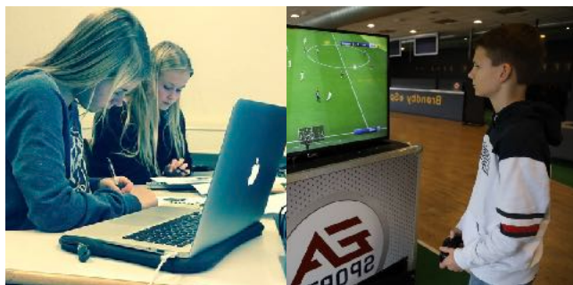
Gode resultater i skolen og til træning.

På vores Eleveltra kan eleverne også dele noter og