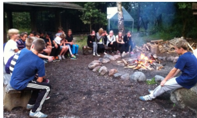
Bålhygge med snobrød og konkurrencer i Middelalderlandsbyen på den fælles introtur ved skoleårets start.

Idrætskoordinatorens vigtigste opgave er at være bindeledet mellem eleverne, skolen og klubberne. Idrætskoordinatoren lytter til eleverne og følger dem både i skolen og til træning. I samarbejde med eleverne sørger idrætskoordinatoren, der også er lærer i klasserne, for at holde klassens lærere og skolens ledelse orienteret om perioder, hvor eleverne har brug for at tildele deres idræt fuld opmærksomhed.